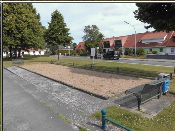
Fotos: Impressionen von Surheider Spielplätzen.