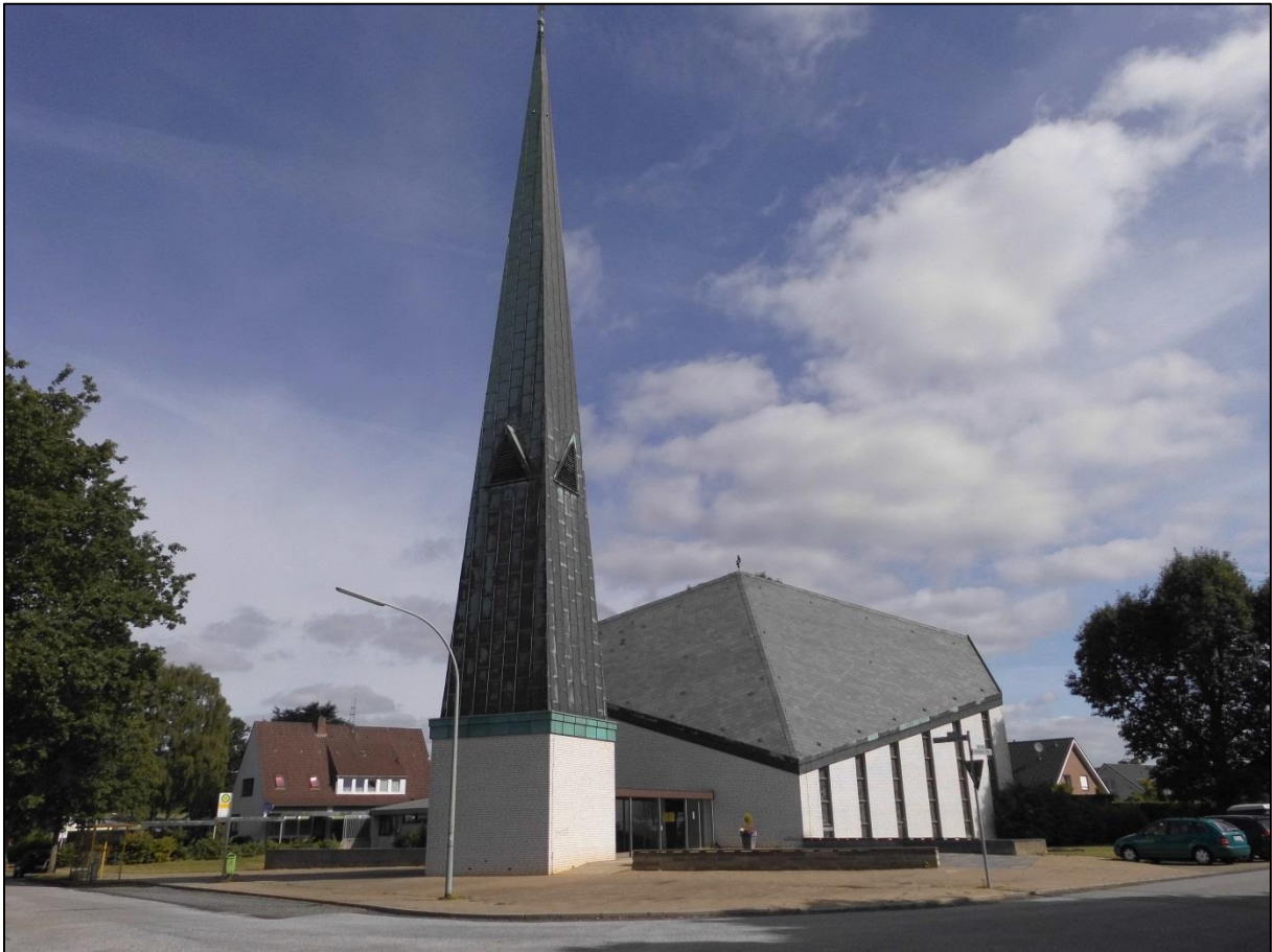
Foto: die ev.-luth. Auferstehungskirche Surheide

www.bremerhaven.de/de/leben-arbeiten/familien-kinder/familienportal/ev-luth-auferstehungskirchengemeinde-bremerhaven-surheide.79237.html